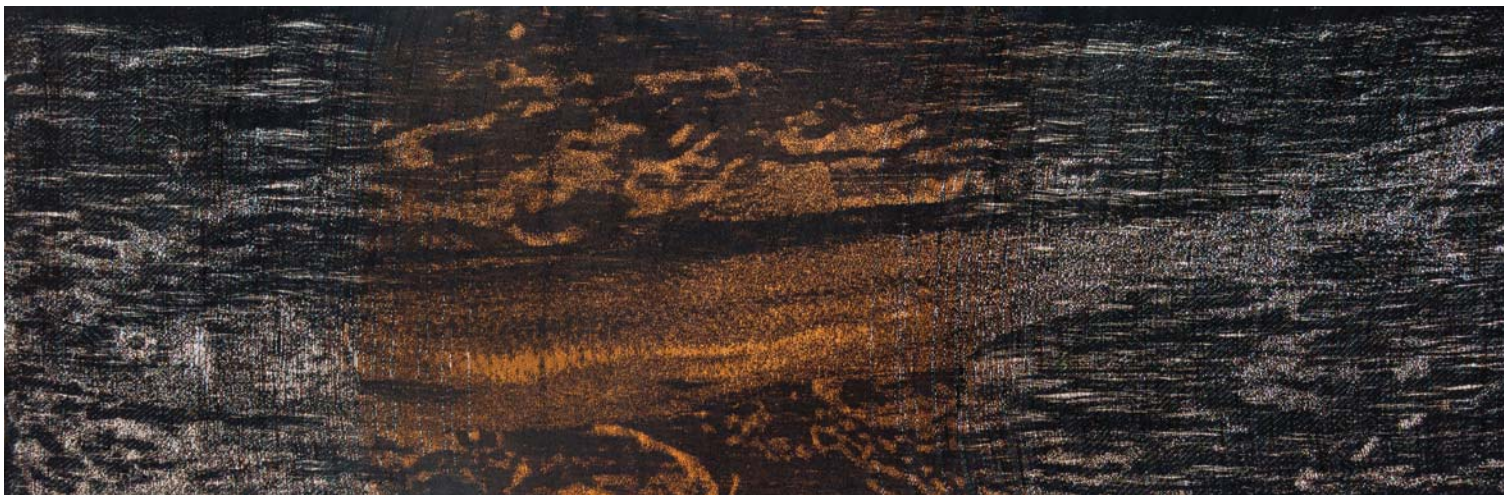
Ruth Beer, Fish , 2014. Jacquard weaving, copper, aluminum, cotton/Tissage jacquard, cuivre, aluminium, coton, 55 x 172 cm.

En plus de Mineral Material , Beer a créé des douzaines de Spills en silicone. Ces déversements sont plats et oblongs, ressemblant davantage à un relief qu'à une sculpture. Ici, la matière agitée s'élève et s'effondre en crêtes et vallées, semblant avoir été interrompue en plein remous. Alors que le pétrole raffiné peut aisément, par sa fluidité, entrer et sortir du monde visible, qu'il s'agisse d'un pipeline ou de notre conscience,