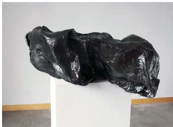
Ruth Beer, Spill , 2013. Installation view/ Vue de l'installation, Nordic House Gallery, Reykjavik.

One of the agonies of grappling with ecocritical discourse is that “it is difficult, if not impossible, to actually see ecological relationships, for they occur either too slowly or in too diffuse a manner to be observed directly.” 4 Addressing environmental issues through the arts may be one way to mitigate the difficulties of the visual when it comes to ecocritical discourse. By giving viewers sculptural objects to contemplate, the Trading Routes project rejects the idea of perpetuating the “invisible economy.” 5 Perhaps this is the power of the visual and the aesthetic