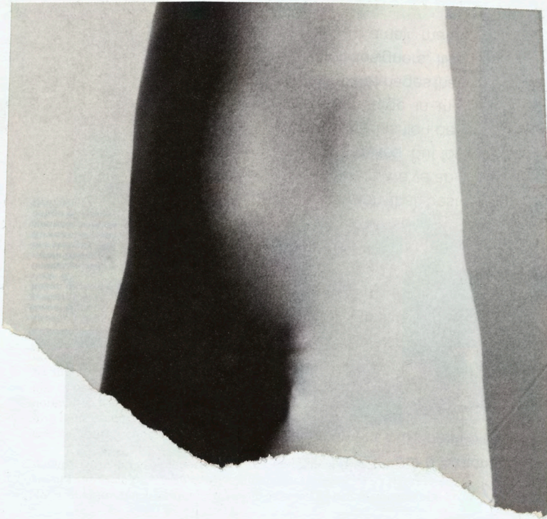
Bronze. 1973 (57×89×64).