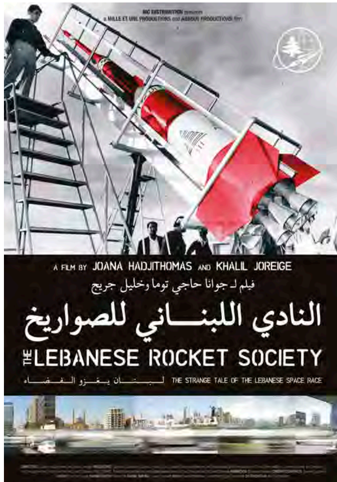
Joana Hadjithomas & Khalil Joreige, The Lebanese Rocket Society , L'Étrange histoire de l'aventure spatiale libanaise, 2013. Avec l'aimable permission des artistes.