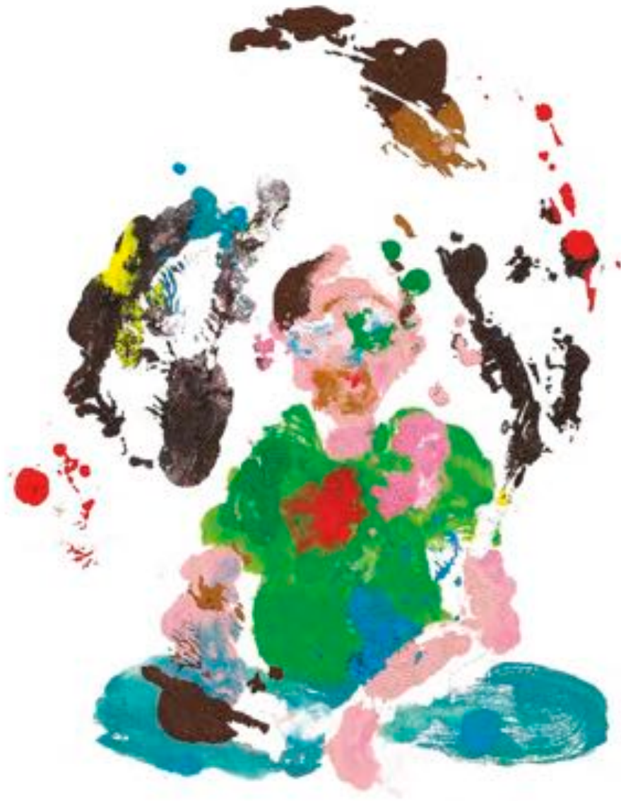
Bryan Lewis Saunders, Khat (Chew and Tea) , 27 octobre 2012. Acrylique sur papier, 20 x 28 cm. Avec l'aimable permission de l'artiste.