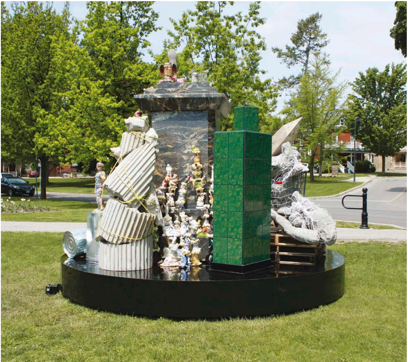
Acapulco, Monuments , 2016. CAFKA - Contemporary Art Forum Kitchener and Area, Kitchener, Ontario. Avec l'aimable permission des artistes. Photo : Acapulco.

de « monument domestique », lui accordant une place parmi les répliques bon marché des chefs-d'œuvre anciens qui trônent devant certains bungalows – ce qui constituerait en quelque sorte son ultime rédemption. Le passant attentif remarquera cependant la présence d'un sourire en peinture aérosol jaune sur la partie supérieure. Voilà qui pique la curiosité : est-ce l'œuvre de vandales ? Ce sympathique graffiti a plutôt été apposé en guise d'appât par les artistes, souhaitant ainsi susciter d'éventuels actes iconoclastes véritables.