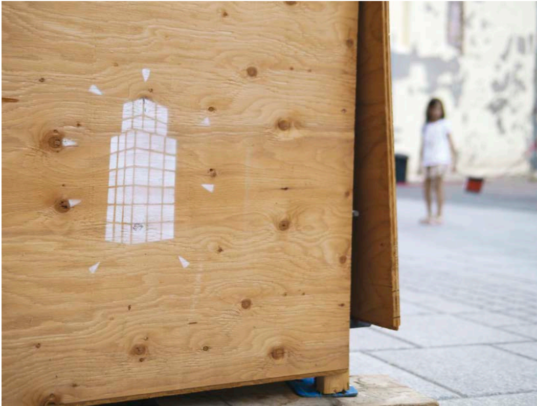
Wartin Pantois, Hommage à Jean Pierre Raynaud , 2015. Peinture aérosol, pochoir, rue Notre-Dame, Québec.

d'ailleurs accentué lors de l'inauguration de la Place de Paris, célébrée en grande pompe en présence d'une fanfare et de soldats en uniforme du régiment de Montcalm. Il semble que le dialogue historique et artistique proposé par l'artiste échappe ainsi à la majeure partie des usagers de la place. À cet égard, remarquons que le titre de l'œuvre est régulièrement escamoté au profit du sobriquet simpliste de « cube blanc », désignation qui, en plus d'être réductrice, est inexacte : la notion de dialogue entre les siècles et entre les peuples français et québécois est de cette manière évacuée.