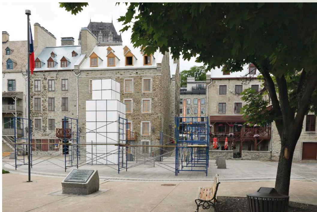
Jean Pierre Raynaud, Dialogue avec l'histoire, 1987-2015. Source : Le Soleil, 17 juin 2015.

Si l'on en juge par l'attention médiatique accordée aux polémiques touchant l'art public, ce type de création apparaît particulièrement propice à la controverse. Vandalisées, démantelées, voire transformées en objets de détestation collective, plusieurs de ces œuvres suscitent régulièrement des réactions négatives – quand elles ne sont pas tout simplement ignorées et négligées. Les cas répertoriés par Nathalie Heinich, dans son célèbre ouvrage L'art contemporain exposé aux rejets : études de cas (Éditions Jacqueline Chambon, 1998), témoignent d'ailleurs à la fois de la récurrence et de la virulence des attaques tant symboliques que physiques perpétrées à l'endroit des œuvres d'art public. Nous analyserons ici la controverse entourant Dialogue avec l'histoire (1987), sculpture réalisée par l'artiste français de réputation internationale Jean Pierre Raynaud pour la Place de Paris située dans le secteur de Place-Royale à Québec. L'œuvre, qui avait fait l'objet de vives critiques dès son inauguration, est détruite de manière spectaculaire en juin 2015 par la Ville de Québec sous prétexte qu'elle était dans un état de dégradation avancé. Cette décision a pour effet de réactiver une controverse latente, alimentée au fil des ans notamment par la publication sporadique de lettres ouvertes décriant l'aspect de la sculpture ou encore par des journalistes insistant sur son caractère prétendument inadéquat pour ce site historique.