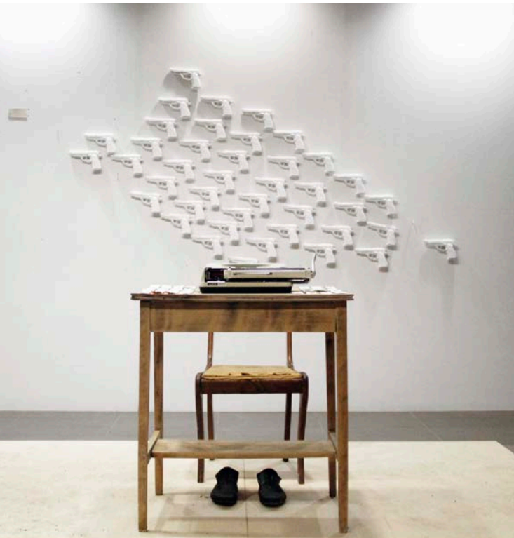
Stanley Février , America... en toute impunité , 2019. Matériaux mixtes, dimensions variables.