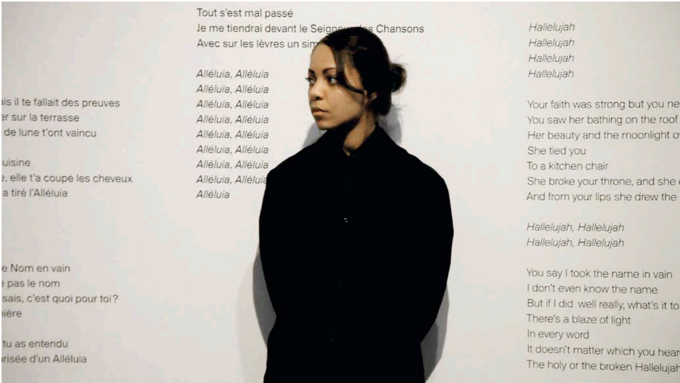
Stanley Février, An Invisible Minority , 2018. Vidéo, durée variable. Infiltration au Musée d'art contemporain de Montréal.