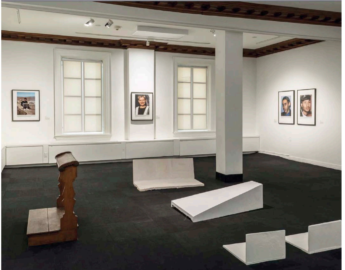
Stanley Février , America... en toute impunité , 2019. Matériaux mixtes, dimensions variables.