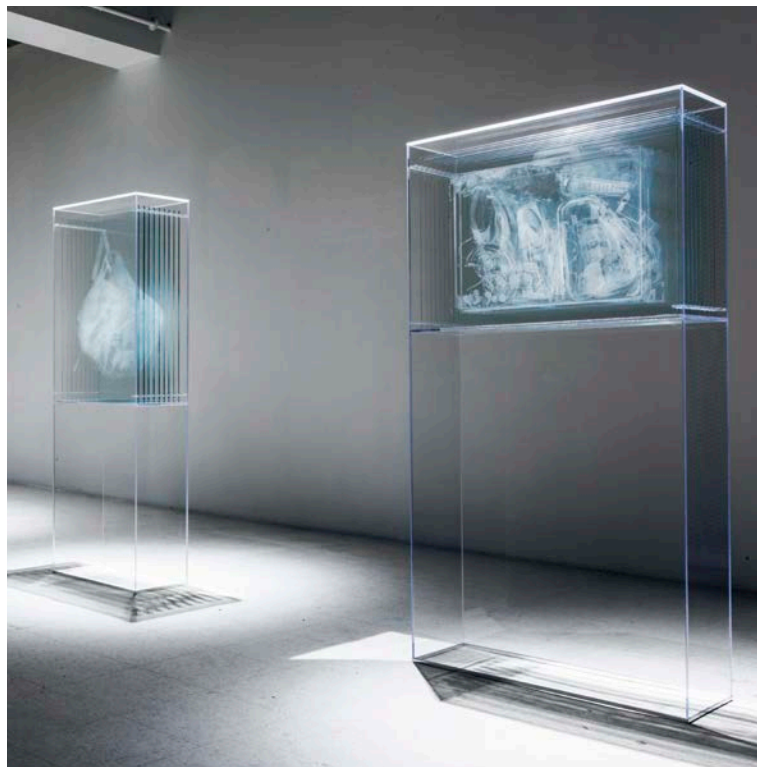
David Spriggs, Transparency Report , 2014. Verre gravé en couches dans une vitrine, 56 x 28 x 152 cm. Photo : David Spriggs.

Avec la série Transparency Report (2014), dont les œuvres ont été présentées chez Art Mûr Montréal et à l'Arsenal, David Spriggs réinterprète la mise en transparence d'objets révélés par les autorités policières ou douanières. Ici, le fond et la forme se rejoignent et l'artiste interroge, par une superposition de feuilles transparentes, les mécanismes de surveillance auxquels les voyageurs sont confrontés, par exemple dans les aéroports. Les successives couches de plexiglas sur lesquelles sont dessinés les objets contenus dans un sac ou une valise dévoilent, comme si on avait utilisé des rayons X, l'intérieur du bagage et donc l'intimité du voyageur. La seule vue de ces objets a priori cachés conduit le policier ou le douanier – et aussi le regardeur, dans l'exposition – à analyser qui est la personne à qui ces objets appartiennent, en se basant uniquement sur eux. Avec Transparency Report , le spectateur est appelé à réfléchir aux enjeux liés à la surveillance accrue et omniprésente dont il est victime, alors que