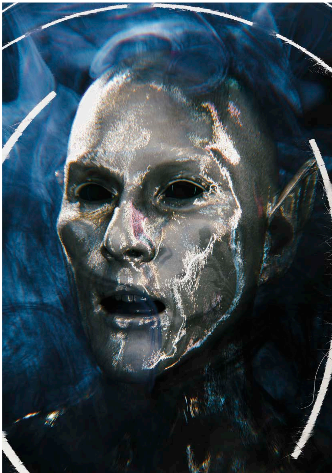
Zach Blas, Icosahedron , 2019. Détail de l'installation, Walker Art Center, Minneapolis, É.-U.