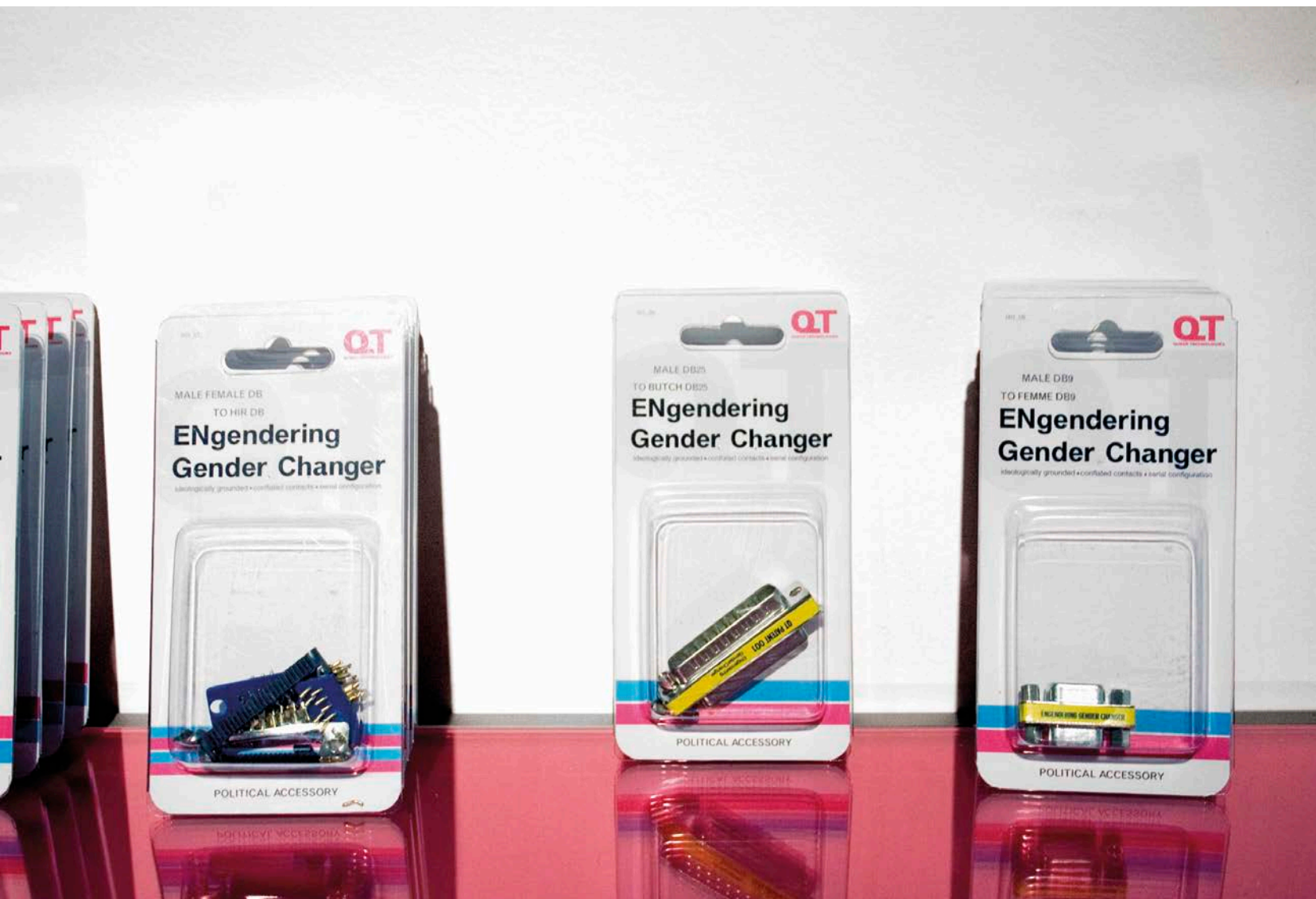
Zach Blas, Queer Technologies: ENGenderingGenderChangers , 2008. Détail de l'installation, New Wight Gallery, Université de Californie, Los Angeles.