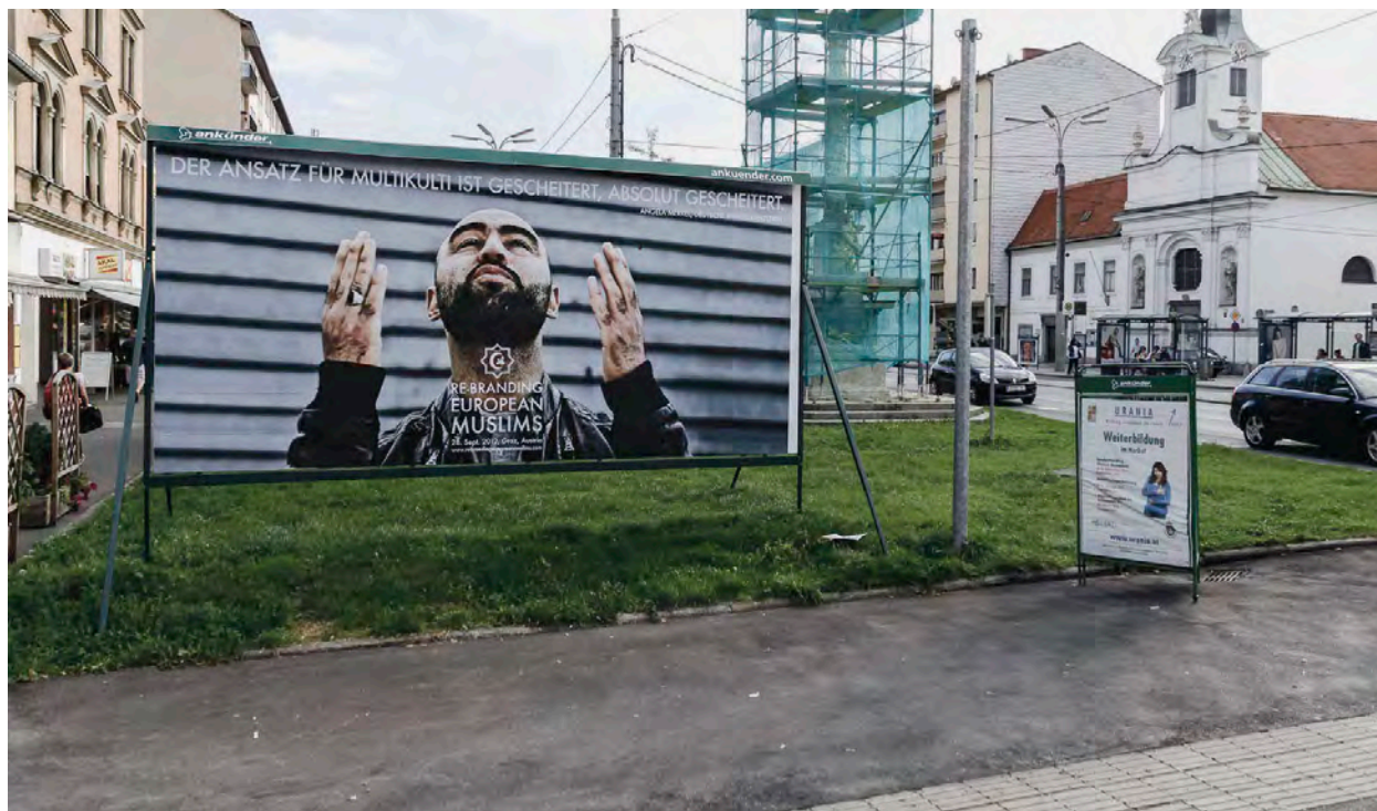
Public Movement , Rebranding European Muslims , Autriche, 2012. Commande du festival stierscher herbst, commissaire Florian Malzacher. Affiche : Luca Conte / Herz – information strategies.

fortement hétérogènes, rendant inopérantes les catégorisations attachées aux définitions traditionnelles de la performance ou de l'art engagé.