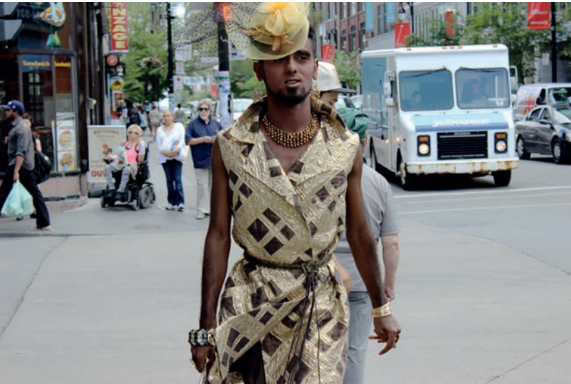
Kama La Mackerel, Race is a drag! , 2012. Avec l'aimable permission de l'artiste. Photos : Elisha Lim.