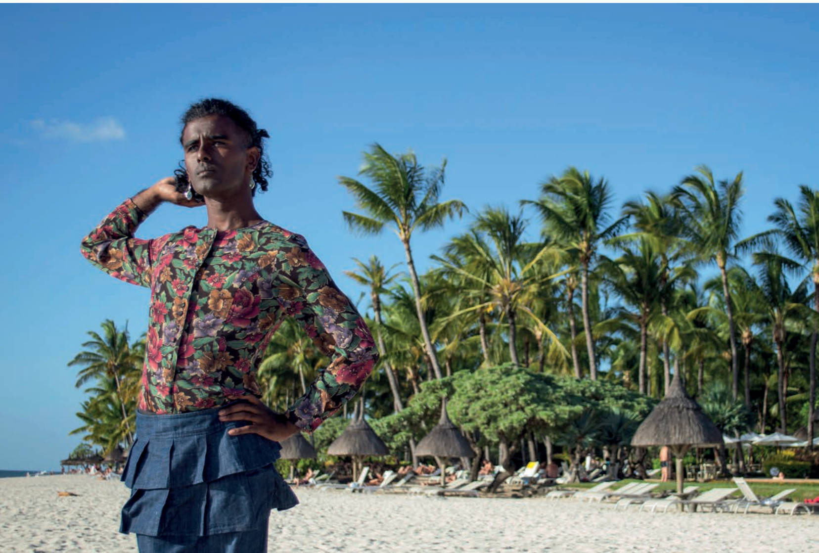
Kama La Mackerel , Breaking the Promises of Tropical Emptiness: Trans Subjectivity in the Postcard , 2019. Avec l'aimable permission de l'artiste. Photos : Nedine Moonsamy.