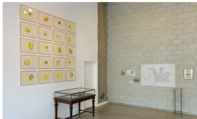
Vue d'exposition, Tropicomania : La vie sociale des plantes , Bétonsalon, Paris, 2012.