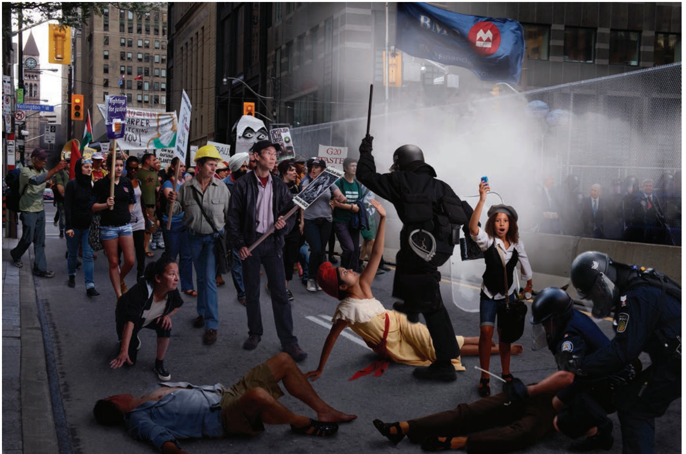
Carole Condé + Karl Beveridge, Liberty Lost (G20, Toronto) , 2010.