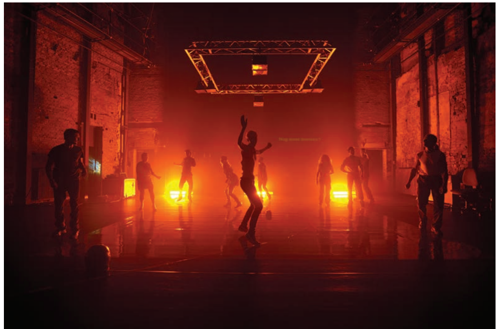
Motus, Alexis. A Greek Tragedy , 2011.