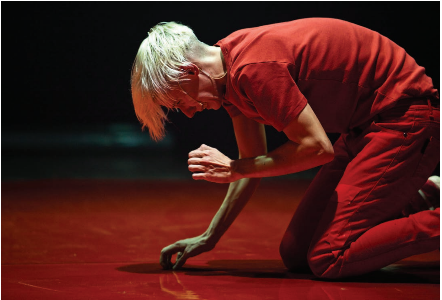
Motus, Alexis. A Greek Tragedy , 2010.