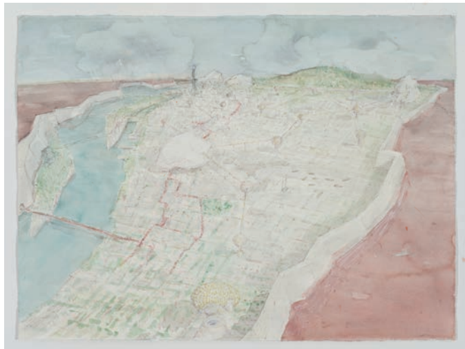
Stéphane Gilot, Multiversité (barrage) , 2012.

C'est avec une exposition des plus à propos que la Galerie de l'UQAM, en présentant MULTIVERSITÉ/Métacampus de Stéphane Gilot 1 , marquait le début de sa saison 2012-2013. Lancé bien avant le « printemps érable », le projet, réalisé par l'artiste durant la saison estivale dans le cadre du programme de résidence de la galerie, souhaitait interroger, au moyen d'une installation multiforme ayant comme point de départ le campus de l'Université du Québec à Montréal, l'université en tant que lieu et institution du savoir. Alors que l'on connaît aujourd'hui l'étendue de la « crise étudiante » et le rôle moteur qu'a joué la communauté uqamienne dans le mouvement étudiant contre la hausse des droits de scolarité, on peut certainement accorder un certain « caractère prophétique » à l'entreprise artistique de Gilot auscultant, tel un géologue, les différentes strates qui composent le monde universitaire, et ce, à travers l'exemple même de l'UQAM.