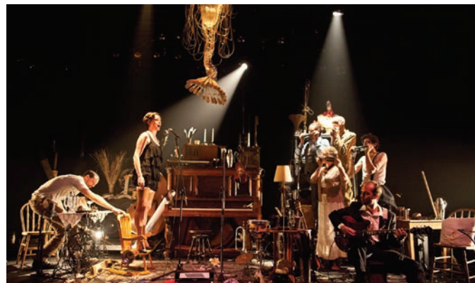
L'Orchestre d'Hommes-Orchestres, Kurt Weill : Cabaret brise-jour et autres manivelles , 2012.