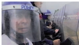
JEREMY DELLER, THE BATTLE OF ORGREAVE, 17 JUN 2001.

On pourrait soutenir que le simple fait de mettre en scène de nouveau un événement historique ou artistique encourage un rapport critique à l'expérience directe ou, à tout le moins, la remise en question du statut de l'événement lui-même, tant comme jalon de l'histoire de la performance que comme objet d'une éventuelle réification dans les musées ou les histoires de l'art 7 . L'idée qui est au cœur de la reconstitution, que ce soit ou non l'intention de son auteur, est que le passé est impossible à recouvrer précisément parce que son existence est dans