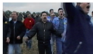
JEREMY DELLER, THE BATTLE OF ORNGREAVE, JUNE 17, 2001.

tive à la notion impossible (quoiqu'obstinément vivace) d'un sens original récupérable et de l'intentionnalité artistique.