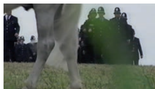
JEREMY DELLER, THE BATTLE OF ORNGREAVE, 17 JUN 2001. PHOTOS: PERMISSION OF L'ARTISTE ET GAVIN BROWN'S ENTERPRISE

Le Pil and Galia Kollektiv entrevoit une manière pour cet échec de l'authenticité de fonctionner du point de vue critique : « Un moment d'histoire n'est jamais neuf, ce qui signifie qu'il n'y a pas d'original à répéter. » Puisant à la notion d'histoire « sans repères ni coordonnées originaires » de Michel Foucault, le collectif pose qu'une reconstitution réussie entraînerait vis-à-vis du point d'origine une déloyauté qui n'est pas un relativisme historique, et qui, en activant plutôt l'histoire à même le présent, nous permettrait d'en finir avec la tentative stérile de passer outre les infinies médiations du spectacle 5 . J'ajouterai à cela qu'une reconstitution qui ne reconnaît pas ces paradoxes se laisse prendre au piège des discours sur l'authenticité et le génie, et s'en remet en défini-