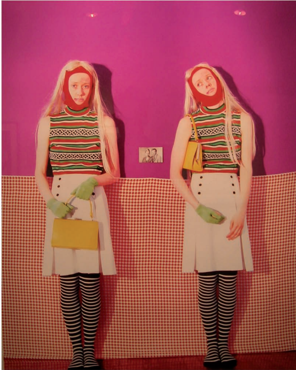
JOHN BOYLE-SINGFIELD, TANTE NETTIE (BOOTLEG) , APPROPRIATION DE L'ŒUVRE DE JANIETA EYRE, 2013.