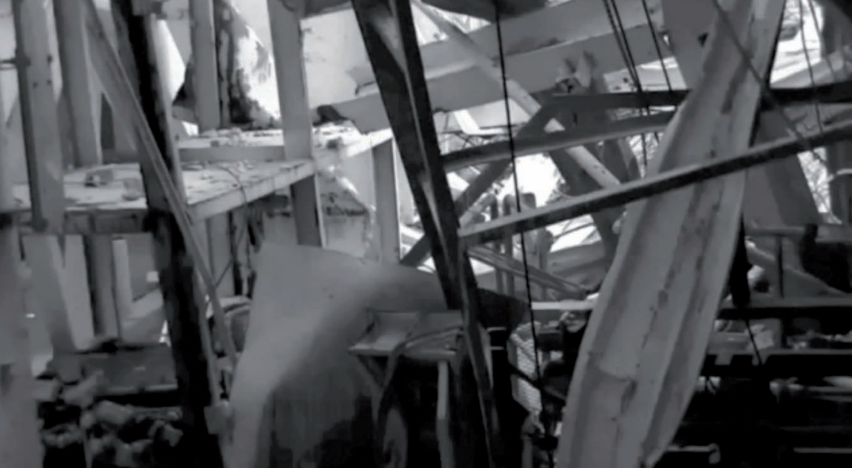
Simon Bilodeau, Ce qu'il reste du monde , 2013, capture vidéo | video still.