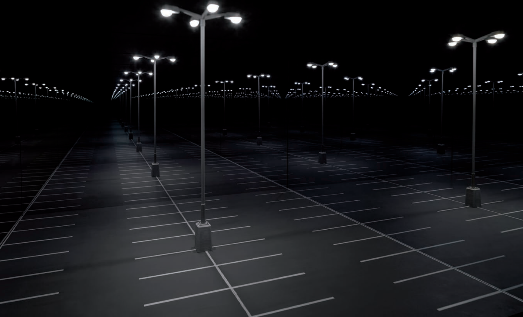
Guillaume Lachapelle, Dernier étage , 2014.