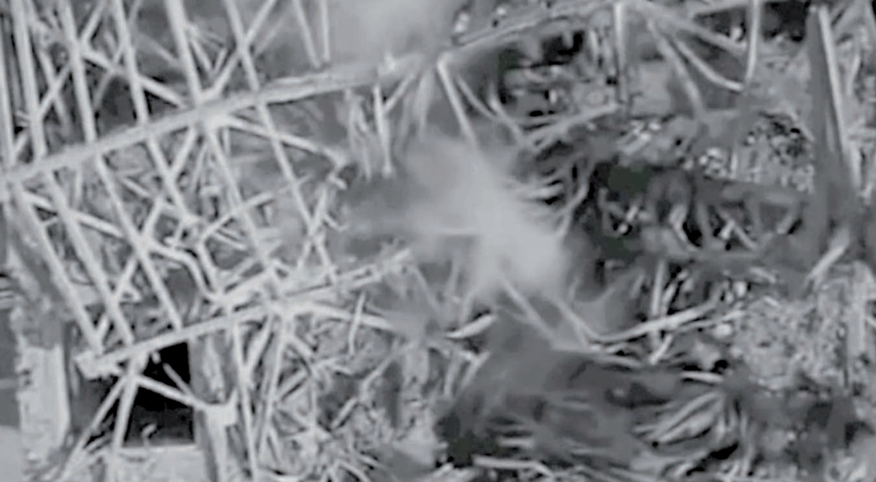
Simon Bilodeau, Ce qu'il reste du monde , 2013, capture vidéo | video still.