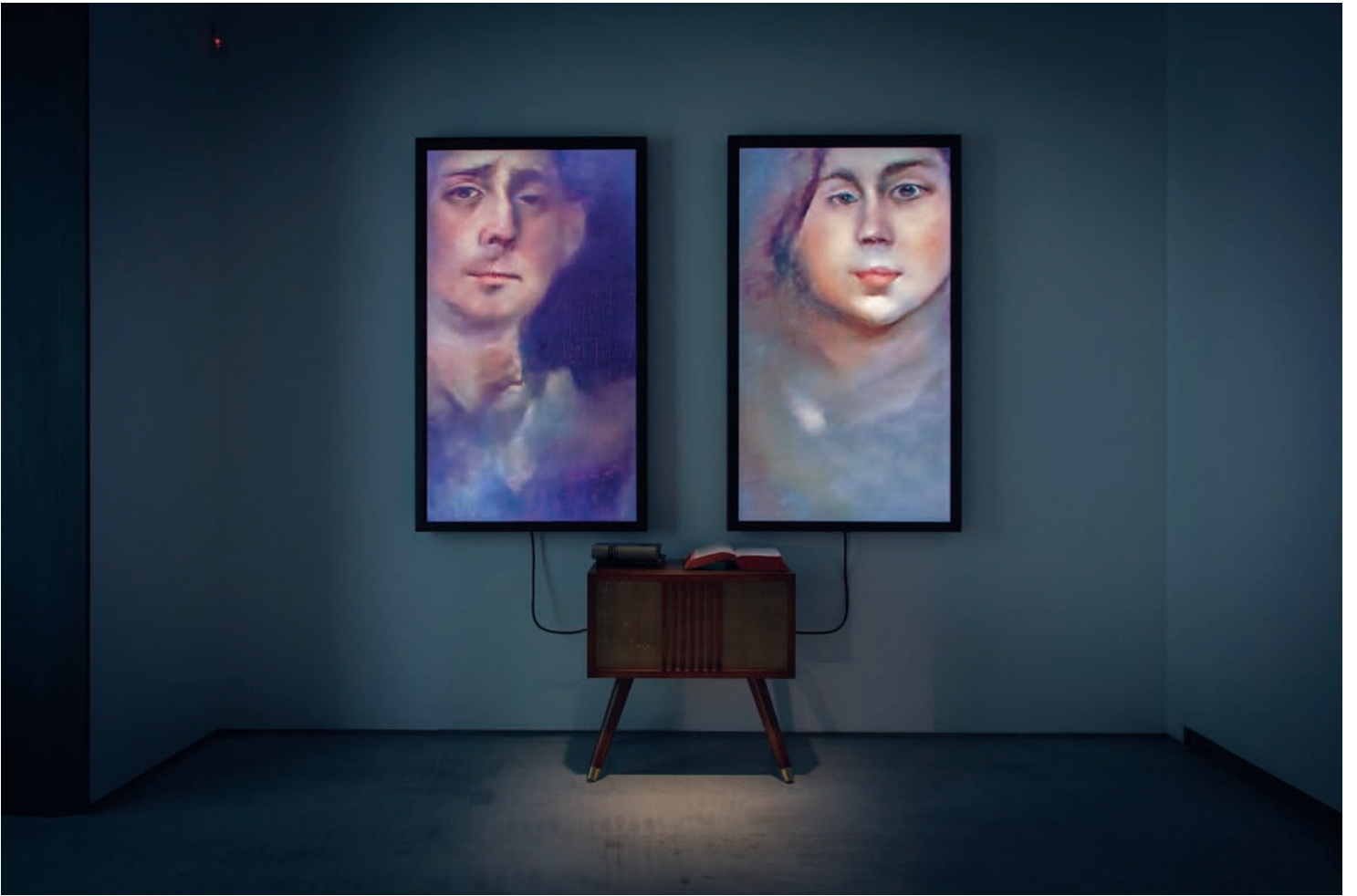
Mario Klingemann Memories of Passerby I , 2018.