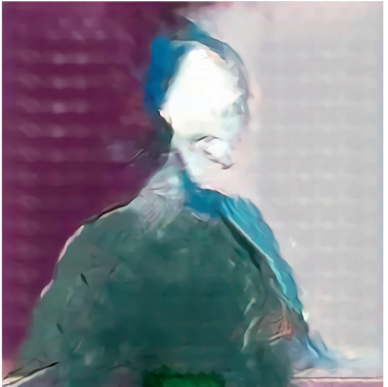
AICAN Faceless Portrait of a Man , 2019. Photo : Ahmed Elgammal - AICAN.io