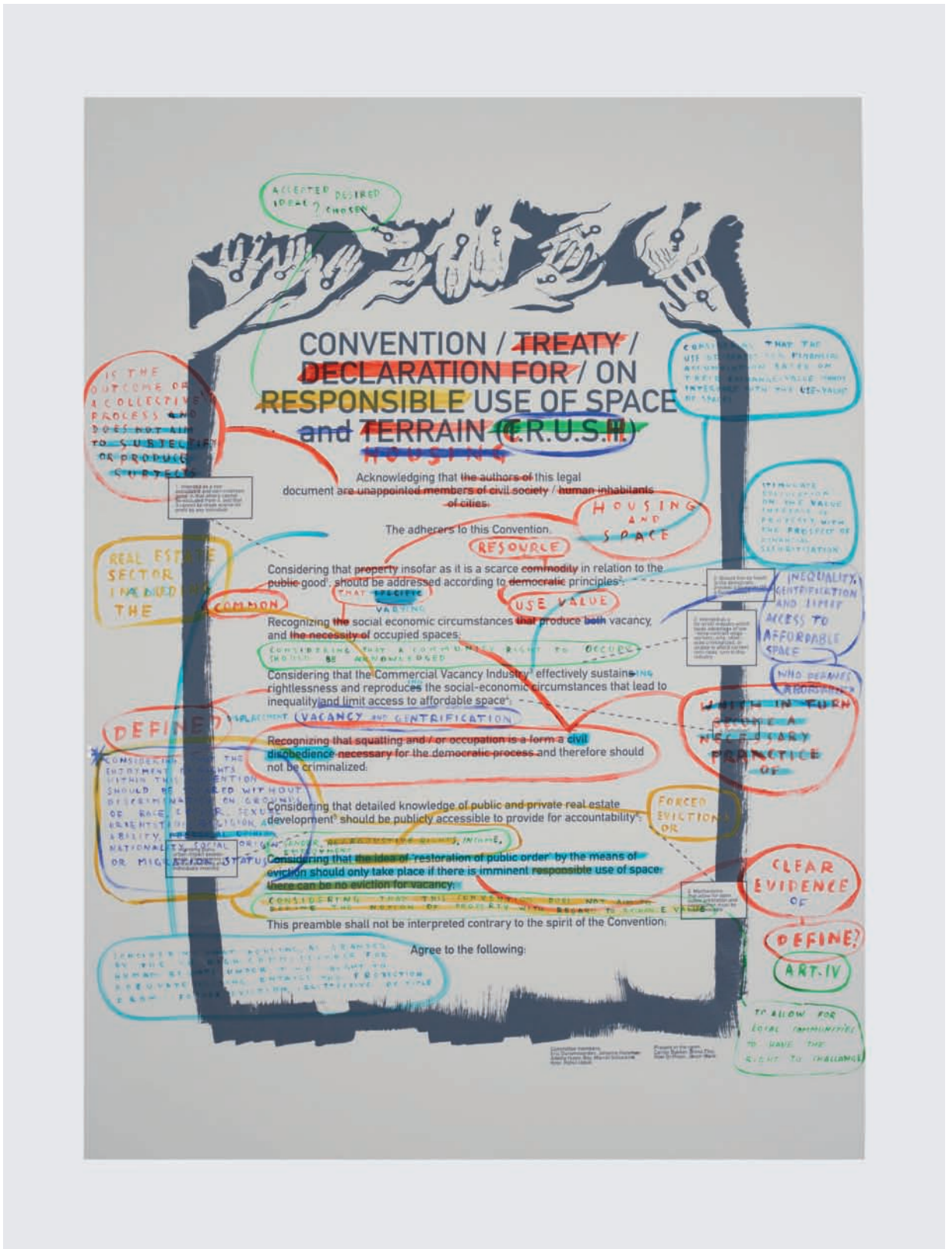
Adelita Husni-Bey White Paper: The Law, détail | detail, 2015.