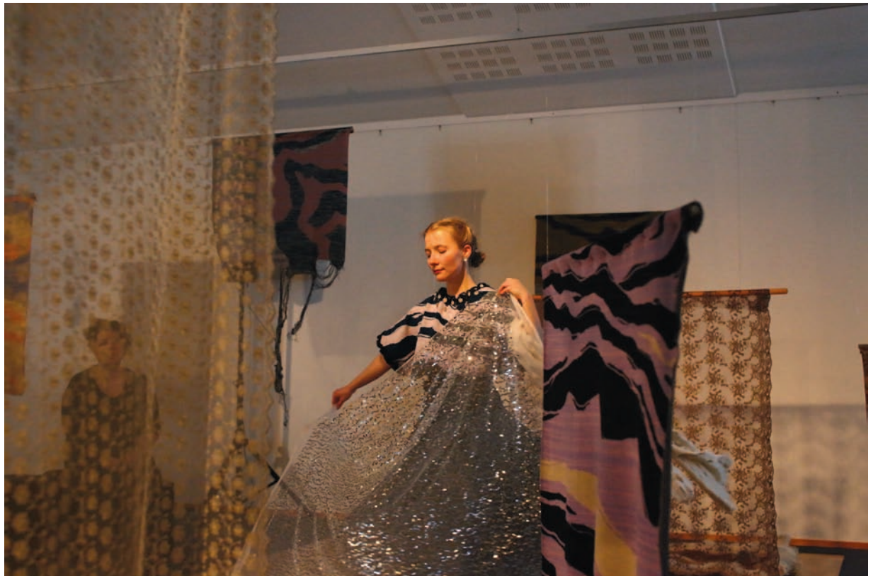
Photo : Susanne Htta, permission de l'artiste | courtesy of the artist