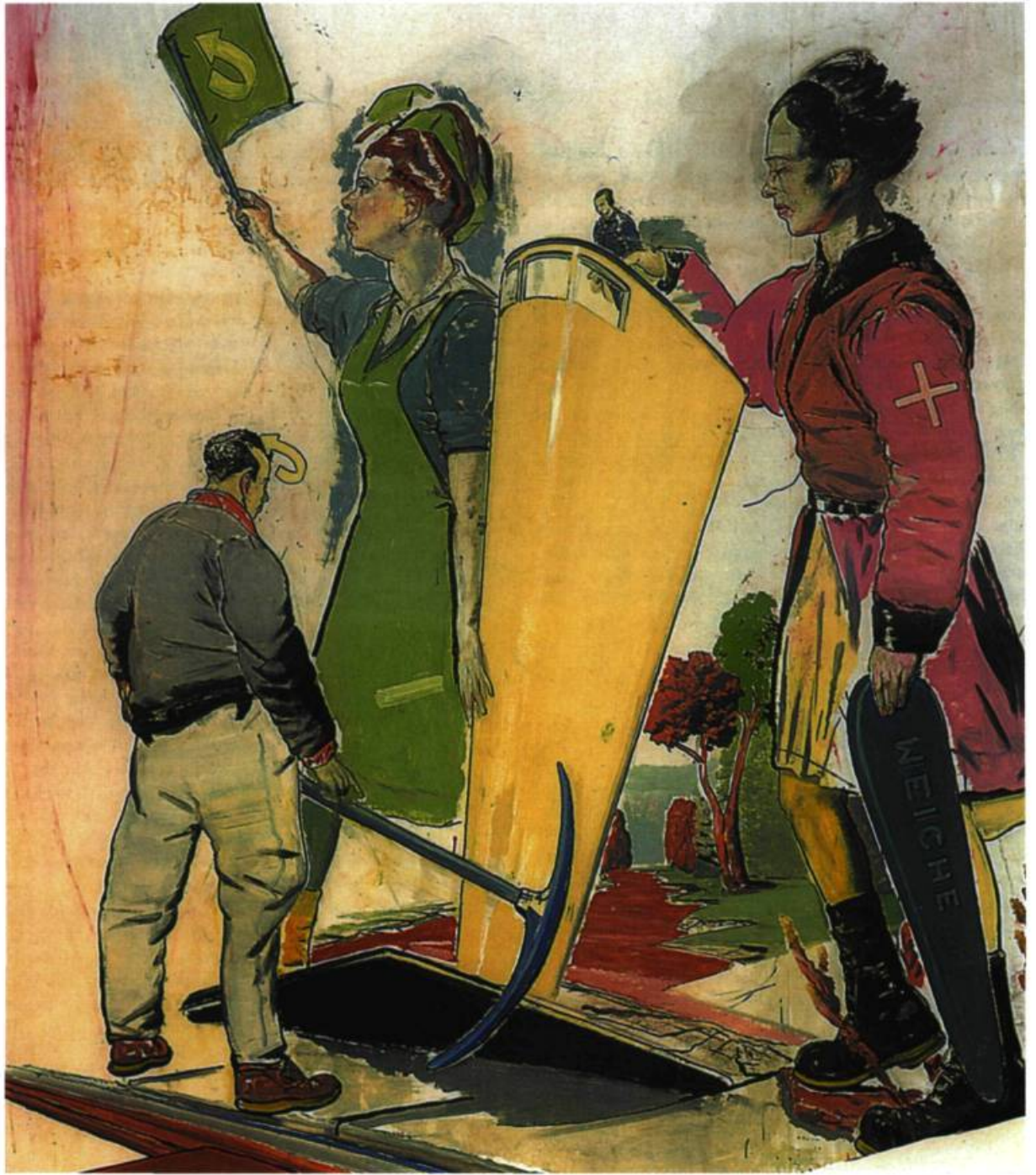
Neo Rauch, Weiche, 1999 Huile sur papier; 215 x 190 cm. © Neo Rauch; courtoisie Galerie Eigen + Art, Berlin/Leipzig. Sammlung Deutsche Bank.