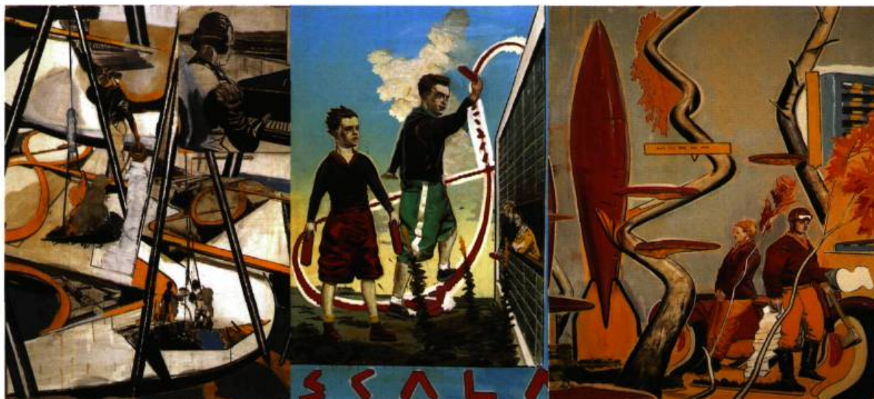
Neo Rauch, Die Große Störung , 1995. Huile sur toile; 273 x 210 cm. Kunstfonds des Freistaates Sachsen.