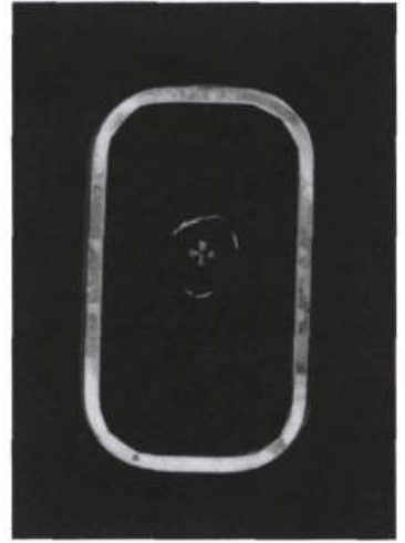
Philippe Favier, Sans titre , 1987

C'est une tautologie. Mais n'en a-t-il pas toujours été ainsi ? Et la contestation, toujours présente, n'a-t-elle pas toujours été plus manifeste aux périodes de grands bouleversements qu'aux périodes de décadence ou de plénitude de sens ? On s'étonne d'un public grandissant qui achète des œuvres d'art à des prix faramineux. Quelles œuvres ? De quel public s'agit-il ? D'institutions publiques ou de corporations ayant collection sur rue ? Les individus sont-ils plus concernés par l'art, par l'art contemporain ? Je crois que oui. L'art aujourd'hui nous montre plus que jamais notre dichotomie collective. Les arts visuels ont pour moi rejoint la musique dans le passage collectif où se croisent décadence et quête d'autres valeurs.