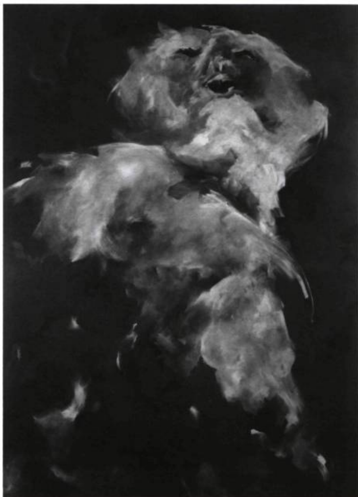
Suzelle Levasseur, N° 173, 1986. Acrylique sur toile; 238 x 173 cm.

Suzelle Levasseur au Musée d'art contemporain, du 17 septembre au 8 novembre, et à la Maison de la culture du Plateau Mont-Royal, du 1 er octobre au 8 novembre — Autre belle complicité que celle du conservateur Gilles Godmer, du MAC, et de Suzelle Levasseur dont l'accrochage musclé arrivait à rendre limpide une des aventures les plus personnelles et les plus consistantes de notre jeune peinture.