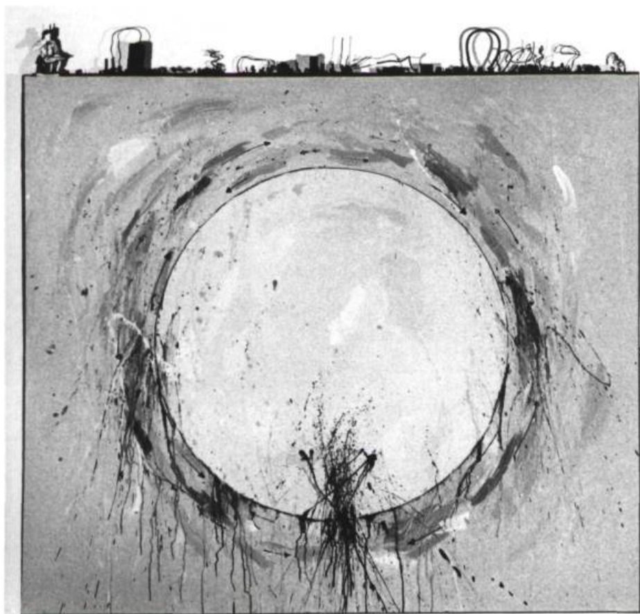
Jean-Pierre Gilbert, Sans appel , 1987. Acrylique sur toile; 46 x 52 po