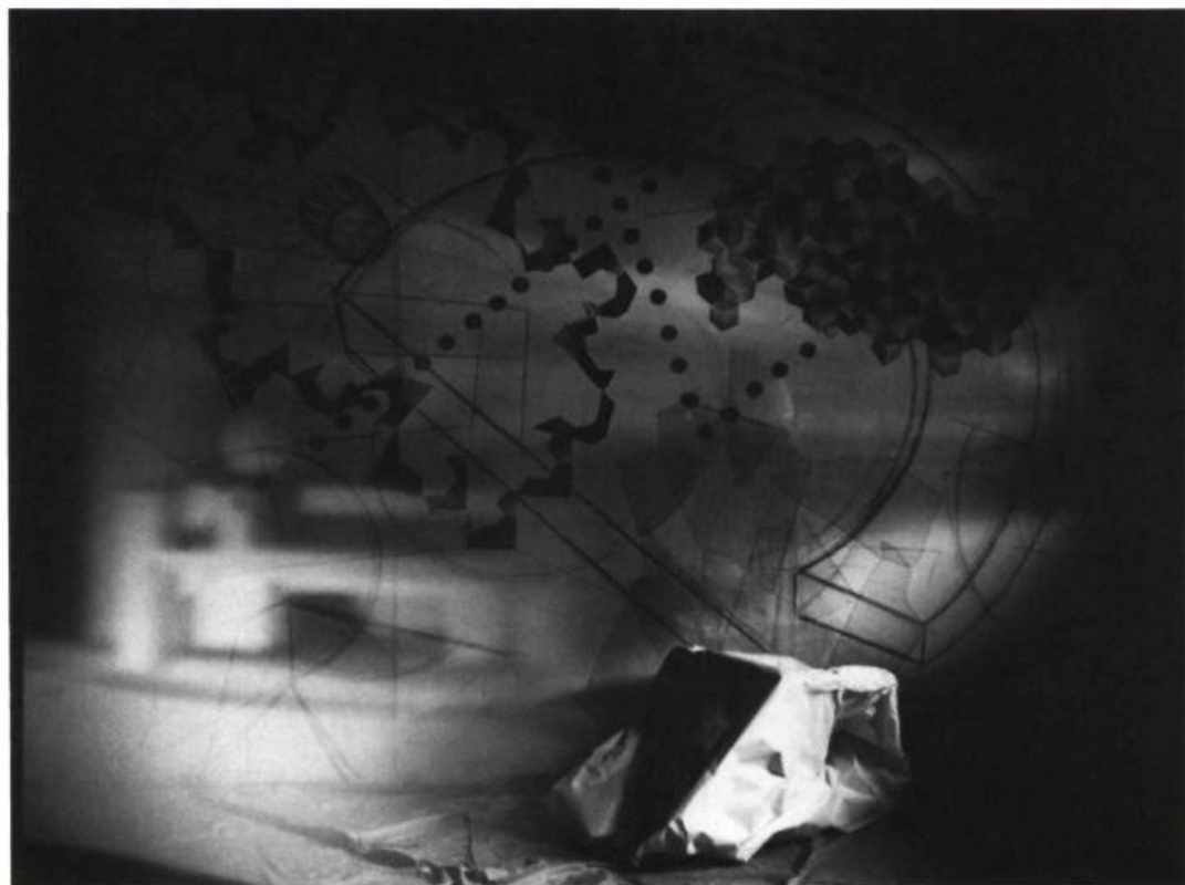
Serge Tousignant, Entre l'ordre et le désordre , 1987. Photo couleur; 127 x 101,6 cm. Coll. de l'artiste

V oies intimes/Voix intimes, œuvres choisies dans la collection du Musée du Québec, à la Galerie d'art Lavalin, du 11 mai au 9 juillet — Tous les visiteurs de l'exposition Stations , en 1987, se rappellent la justesse, l'ingéniosité et l'originalité avec lesquelles le conservateur Roger Bellemare avait reformulé les 14 moments du chemin de la Croix, en puisant dans son musée imaginaire. On avait alors beaucoup parlé du caractère intimiste de ce parcours à la fois étrange et familier.