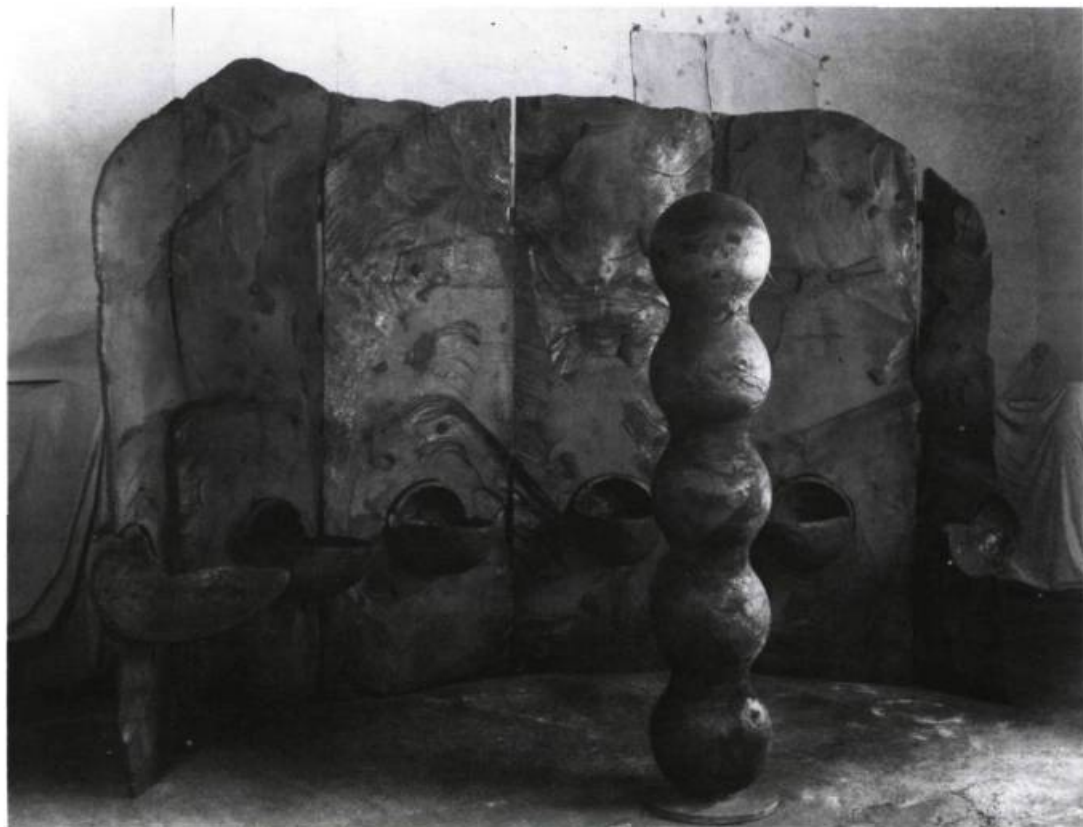
Jaume Plensa, La porte du rêve , 1988. Fer; 297 x 395 x 220 cm.

L a France l'été, c'est 420 festivals, 1 025 stages de musique ou de danse et encore plus d'expositions, s'ajoutent à cela 2 000 musées permanents et plus de 2 500 monuments historiques ouverts au public. Ces chiffres démontrent bien que nous avons tort de résumer à Paris toute l'activité culturelle française; on ignore ou on oublie d'aller voir en région les musées et les «espaces d'art contemporain». Compte tenu de leurs moyens financiers et de leurs effectifs, les collections permanentes de ces musées sont étonnamment riches, et le calibre des expositions, souvent remarquable, justifie bien un déplacement. Fait à signaler, il est toujours possible dans un de ces musées régionaux de voir les œuvres des collections permanentes car elles occupent les murs et non les remises du musée.