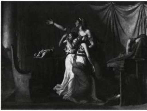
David, Les Licteurs rapportent à Brutus les corps de ses fils (détail), 1789