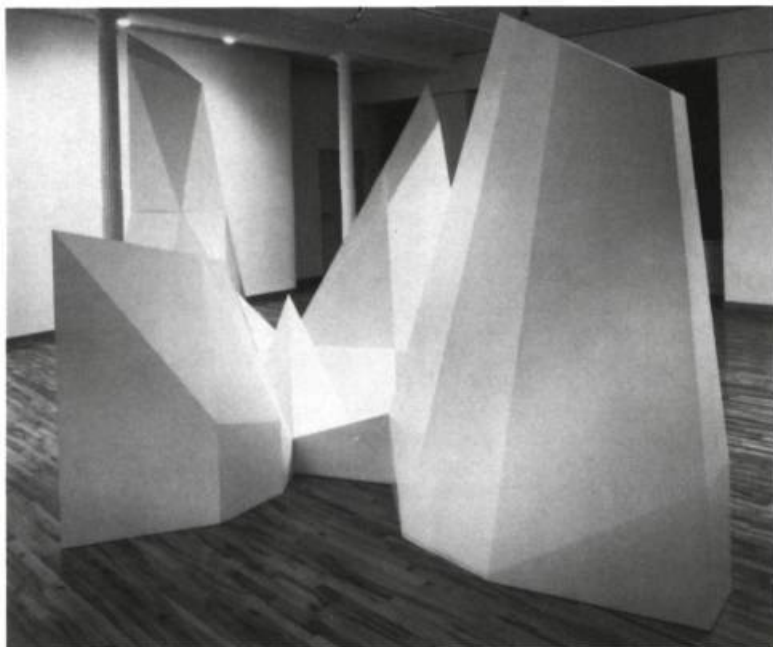
Sol Lewitt, Complex forms No.7 , 1987. Peinture émail sur bois; 254 x 330 x 489 cm.

V éhicules de perception — Sol Lewitt, New structures , John Weber Gallery, New York, du 7 au 28 mai 1988 — «Des lignes, pas courtes, pas droites, qui se croisent et se touchent, tracées au hasard, utili- sant quatre couleurs (jaune, noir, rouge et bleu) uniformément réparties avec un maximum de densité, couvrant toute la surface du mur.»