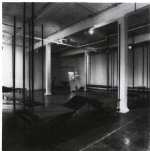
Lucie Ruelland, vue d'ensemble de son installation.