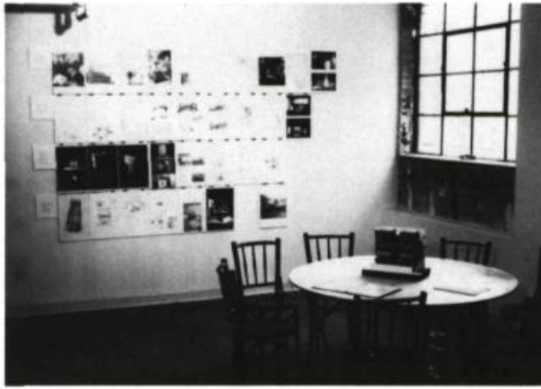
Jacques Rousseau, A table, la maison coloniale , installation.

l'ensemble de ses parcours urbains. Les gens s'installent provisoirement dans des décors versatiles et même ceux qui cultivent des habitudes se trouvent bousculés par les changements incessants du tissu urbain. Le siège, surtout en version individuelle ou de petits groupes figure une rythmique du nomadisme. Les matériaux qu'a utilisés Ruelland vont d'ailleurs dans ce sens. Le néoprène, le corian, l'aluminium, l'acier appartiennent à la ville et restent anonymes, interchangeables.