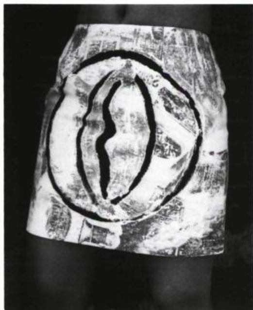
Jacques Marchand, Jambe à la culotte blanche , 1988

Mingolla démontre à son tour que de l'expressionnisme sauvage, nos jeunes peintres n'ont retenu que la sûreté, car le mûrissement de la couleur, couleur, la construction parfois douloureuse des formes dans l'espace, l'utilisation de la figuration à d'autres fins, semblent indiquer la voie d'une nouvelle intransigeance. Mais outre cette cérébralité picturale dont la relève reprend le flambeau aux anciens, l'exposition montre des voies traversières riches de questionnements sur la destinée humaine.