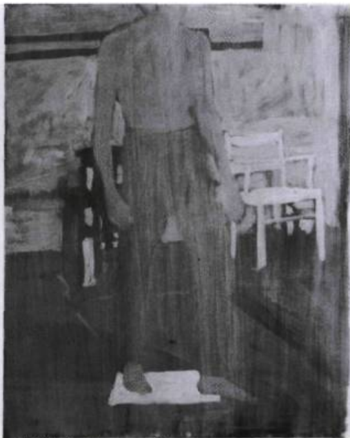
Raymond Lavoie, Tableau sourd , 1987. Acrylique et graphite sur toile, acier; 152,4 x 243,8 cm. (diptyque).

«Non, que jamais il n'y ait de victoire pour ceci : le Non-être est!» Sur la nature , Parménide