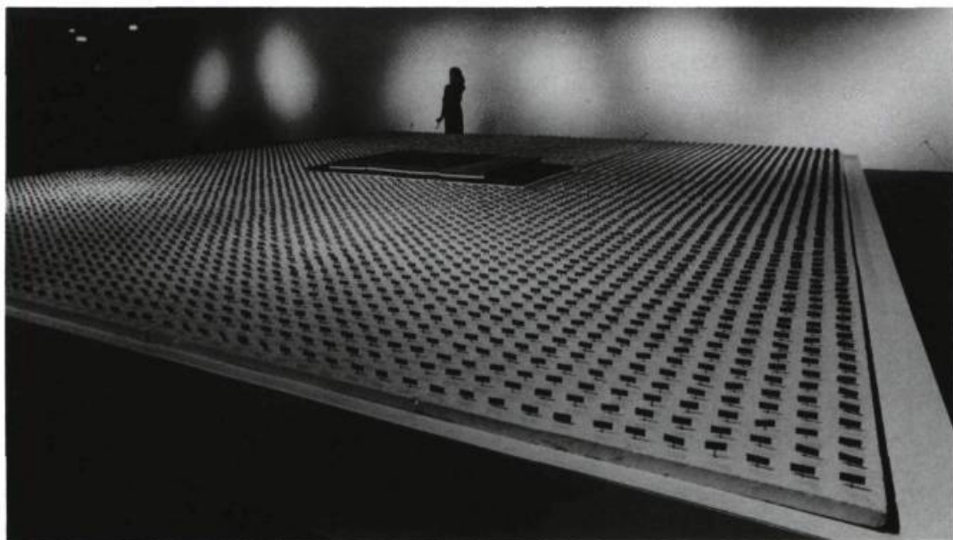
Rober Racine, Le Terrain du dictionnaire A/Z , 1980; 16 x 853,4 x 731,5 cm. Collection Musée d'art contemporain de Montréal.

nelles. Mon intérêt pour les documents que je sélectionne n'est pas d'un ordre esthétique, je cherche à comprendre comment, à partir de la photographie, de l'ordonnance de certaines photos, on peut arriver à créer de la réalité, à bâtir de l'identité. Le sujet choisi par chacun de nous lui est spécifique, mais c'est surtout la manière dont il sera développé qui marquera toute la différence. Je dois avouer que la revendication par certains artistes de la propriété exclusive de «leur» idée ou de «leur» couleur m'agace un peu. Je ne suis pas du tout d'accord avec cette façon de voir les choses parce que, tant dans le cas des couleurs que dans celui des documents, ceux-ci sont «accessibles» à tout le monde. Je ne fais que les emprunter pour créer des structures, des histoires et faire voir d'autres sens. Il serait intéressant de comparer ce que quelqu'un d'autre pourrait réaliser à partir des documents que j'utilise.