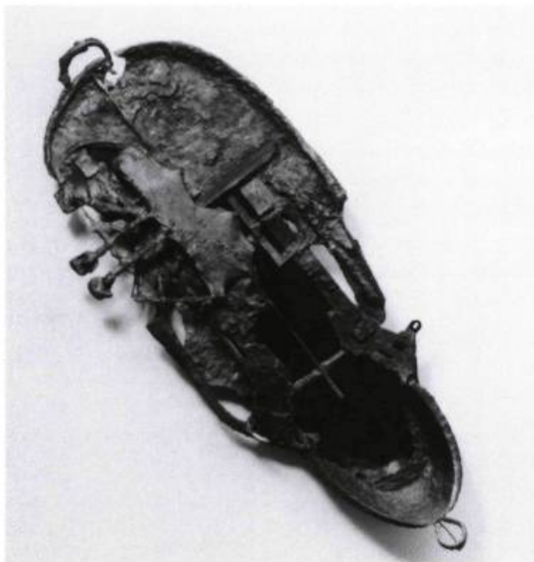
Laurent Pilon, Modèle réduit , 1989. Résine polyester, 235 x 103 cm.

La formule citationnelle, fréquente dans les soubresauts d'un mouvement dit postmoderne, n'est-elle qu'un désir d'acquiescer un droit de cité ? Qu'en est-il de la vérité de l'œuvre lorsque le document cité devient la base le sujet ? Devant l'avalanche de styles extrayant le document des sources les plus inusitées, on est en droit de se demander si un sens nouveau peut être fourni aux valeurs que l'on veut actuellement défendre. Pour répondre à ces questions, nous vous présentons le compte rendu de la table ronde organisée par la Société d'esthétique du Québec dans le cadre du Congrès de l'ACFAS, tenu à l'Université du Québec à Montréal en mai dernier, et qui réunissait quatre artistes parmi les «mieux» documentés.