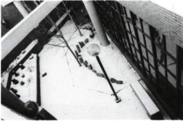
Carole Beaulieu, Sans titre , 1989. Granit et cuivre.

démarche et celle que nous observons aujourd'hui. Métro d'art se lit comme une exposition thématique, les artistes «interrogeant le rôle et la fonction de l'art confronté au mouvement des foules, à la rapidité du regard, au temps de passage».