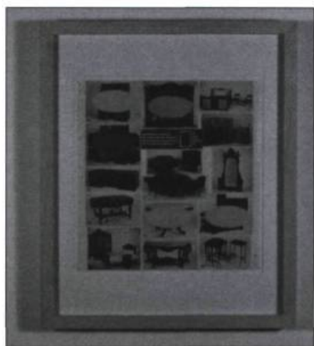
Raymond Lavoie, Notes , 1990

D'entrée de jeu, l'exposition montre des tableaux dans une suite rigoureuse de transitions : des propositions de tableaux déjà pleinement conçus et,