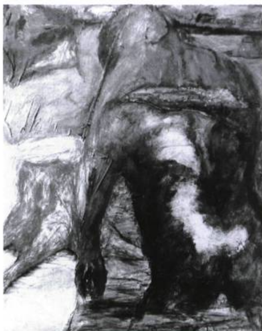
Laurence Cardinal, À vigie , 1990. Technique mixte ; 1,22 m x 1,52 m.

L'exposition des œuvres récentes de Laurence Cardinal marque un passage vers une maturité plastique et picturale évidente. D'abord par l'abandon de la toile libre, mode néfaste héritée de Support-Surface, qui, justifiée par le discours esthétique de ce groupe, devient superfétatoire chez nombre d'artistes. Laurence Cardinal structure son tableau en utilisant un châssis. L'ajout de matières diverses, papier, carton, pâte à modeler, etc. bien intégrées, amplifie cette structure, lui procure des assises et fortifie le tableau. Voir le catalogue, page 4, À Vigie . Parfois ses rajouts alourdissent la surface au lieu de la dynamiser. Catalogue, page 8, Enan. Orsain . Dans sa production actuelle l'artiste renonce aux tons délavés de ces toiles précédentes pour une palette mieux maîtrisée à dominante de rouge / orangé, jaune / beige. Cependant, l'apparition d'un timide bleu azur et d'un rose adouci dans À Vigie (le meilleur tableau de l'exposition) démontre que Laurence Cardinal ne délaisse pas totalement la coloration de ses œuvres anciennes mais la raffine et la contrôle plus efficacement. Son travail chromatique laisse sourdre une