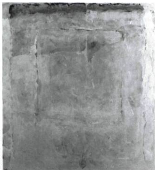
Jean McEwen, Absence au carré #1 , 1991. Huile sur toile ; 200 cm x 183 cm.