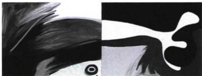
Christiane Ainsley, J'ai plongé la tête la première, les yeux fermés , 1990. Acrylique sur toile ; 45,7 cm x 1,22 m.

lumière indéfinie. Donc une œuvre à ses débuts faite de recherches, de redites, d'hésitations, mais aussi d'une grande passion de peindre et d'une volonté de « dire » la séduction, la violence... Un catalogue avec un texte très sensible de Lise Bissonnette prolonge le souvenir de l'exposition.