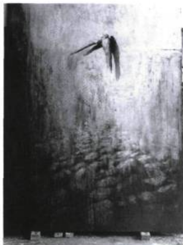
Kevin Sonmor, Painters landscape with horse , 1990. Huile sur Toile ; 2,5 m x 1,9 m.

Tout en monumentalisant ses formats, l'artiste travaille sur la morpholo-