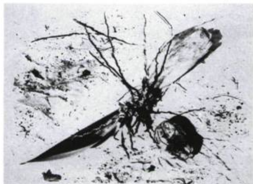
Ginette Bouchard, Empreinte mimétique n° 5 , 1990. Épreuve au paladium ; 37 cm x 57 cm.

27 octobre - 3 novembre : Charlotte Fauteux