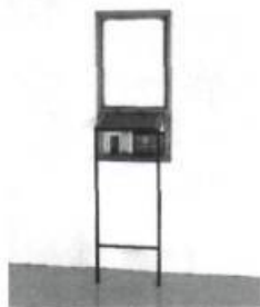
Élène Gamache, Nature morte aux anges et poisson , 1991, 76 cm x 108 cm.