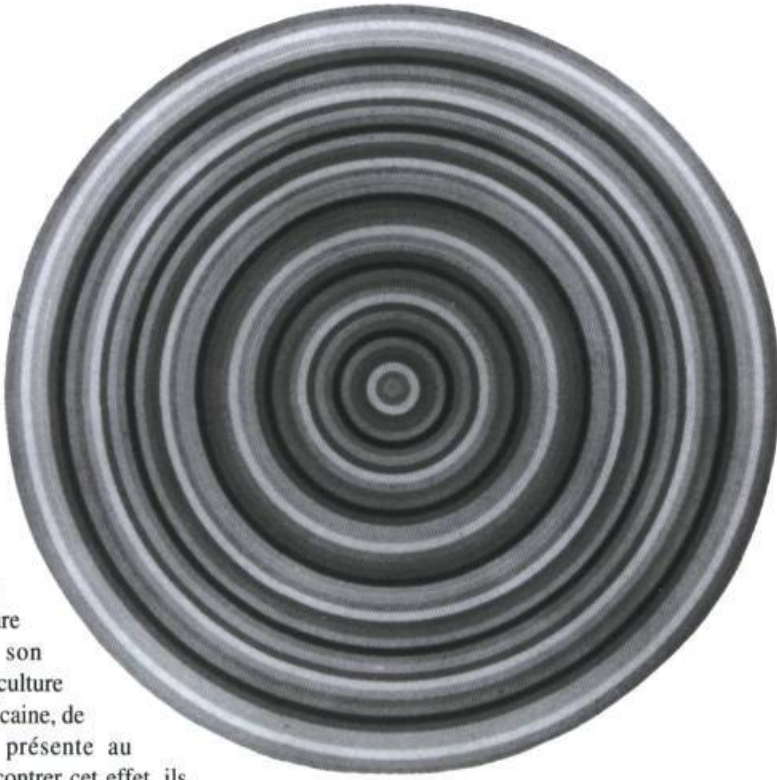
Serge Tousignant, Accélérateur chromatique , 1968. Acrylique sur toile ; 90 * de diamètre.