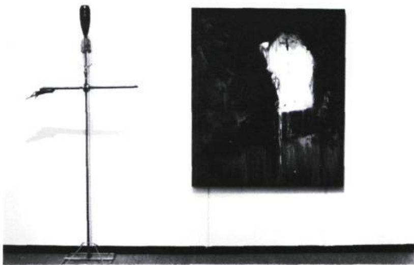
Jean-Pierre Gilbert, Croisée , 1992. Huile sur toile, fonte, plomb et acier; 137 x 198 x 30 cm.