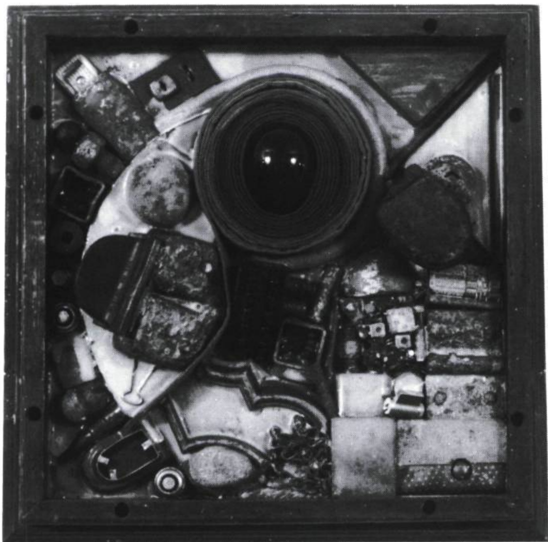
Roch Plante, Kipabilité , 1991. Objets trouvés.

Roch Roch Plante, Cinquièmes trophées , Galerie Madeleine Lacerte, du 6 au 23 mai 1992, ou des diverses manières de mettre l'art en boîte.