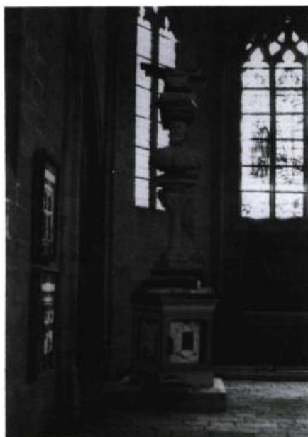
Pierre Ayot, Les grandes aventures de Benvenuto Cellino , 1989. Techniques mixtes sur bois ; 518 x 152 x 152 cm. Collection de l'artiste.