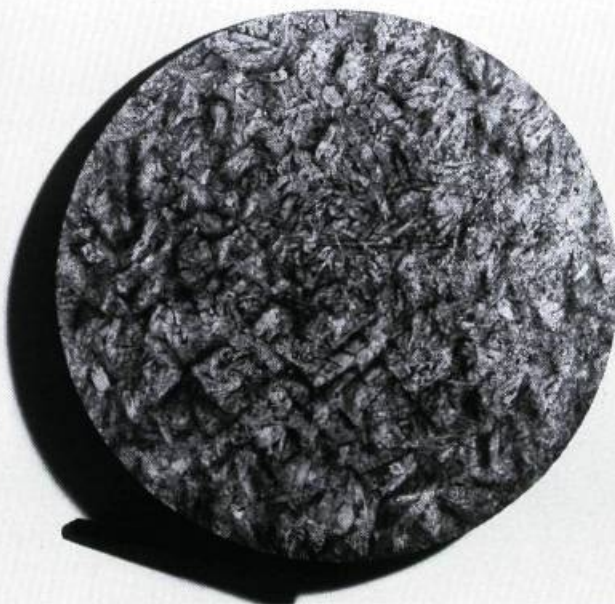
Suzanne Roux, Défriché , 1992. Techniques mixtes sur particules de bois, tige de bois peint; diamètre : 107 cm.

nous restituer l'objet représenté, qu'il soit branche, main ou objet fictif, cette façon de le faire émerger du tourbillon chaotique de la surface, de le projeter dans la direction du regardant. Peut-être est-ce là, en dernier lieu, la définition de l'objet, qu'il soit peint ou réel : une entité se nommerait objet quand y est inscrite une sollicitation à l'appropriation.