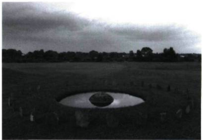
Jocine Rainville, Antinomie , 1996. Aluminium, cuivre, bois.