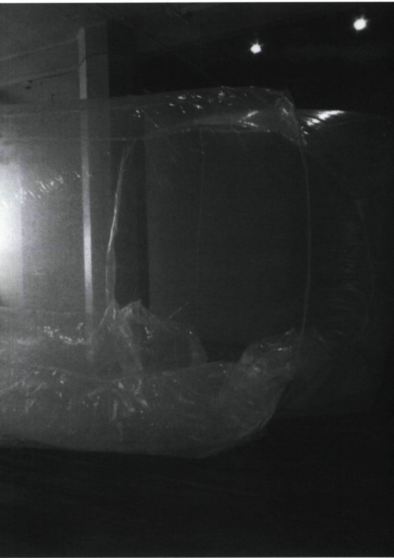
Anna Amadio, Révéléateur d'espace , 1994. Plastique transparent, air.