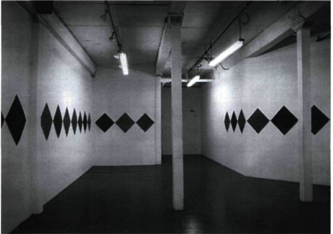
Louise Paillé, Danse macabre (détail), 1996. Papier.

Louise Paillé, Danse macabre , Galerie Yves Leroux, Montréal. Du 17 octobre au 16 novembre 1996