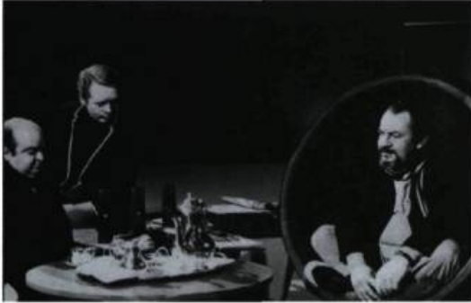
Le Prisonnier, Polygram Television.

Peu d'articles généraux, beaucoup de noms propres. Entrée destinée à disparaître, faute de combattants ayant pris de la bouteille. À quel âge cesse-t-on d'être de la relève ? Peut-on le demeurer à vie, comme un automatiste par exemple, ou une éphémère ? Il serait peut-être plus simple de numéroter les générations, mais alors qui voudrait faire partie de la treize, de la vingt et quart ? En disant « génération X » ou « génération lyrique », d'aucuns ont cru régler le problème. Les essayistes auraient été mieux avisés de commencer par « génération A », l'alphabet promettant un bel avenir radieux (un peu limité, soit, malheureusement nous ne sommes pas Chinois). Quant au « lyrisme », pour des spécialistes en arts visuels, là encore, quel bel avenir quand on pense à tous les noms de mouvements, de périodes, etc., que l'on pourrait donner aux divers groupes d'âge : la génération dégénérée, la génération povera, la transgénération.