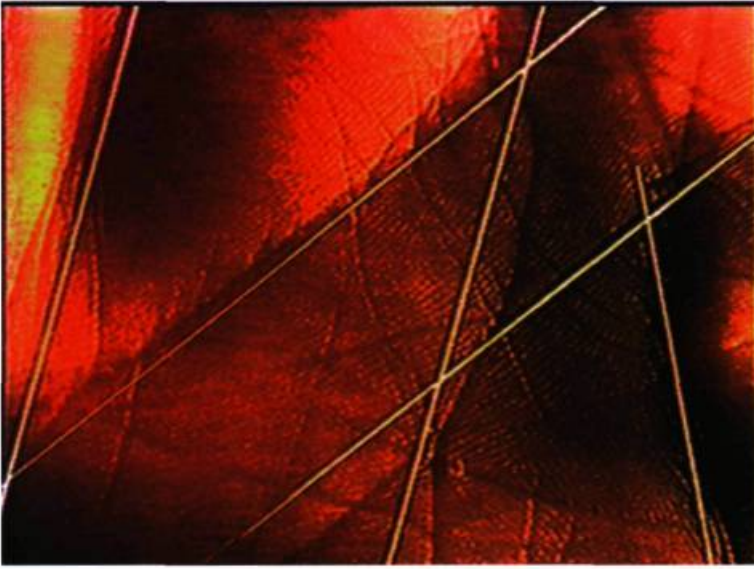
Yan Breuleux, Variations , 1997. Canada.