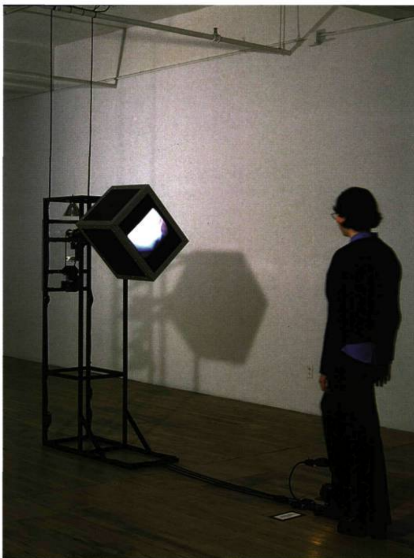
Martin Boisseau, Deuxième temps : rotatif chorégraphique , 1998. Moniteur, lampes, verre, pédale, métal, moteur.

que. L'œuvre porte à l'éveil des mécanismes qui engendrent une interdépendance entre la machine et le visiteur. Ce dernier sait très bien qu'il peut quitter la galerie sans avoir activé la sculpture, mais il y aura alors une perte qui ne pourra être vraiment remplacée par le fait d'être témoin de la tentative d'une autre personne. De toute manière, il y aura frustration. Celle de ne pas satisfaire un désir ou celle de se retrouver dans une situation sans issue. Le visiteur mesure très rapidement les limites dans lesquelles se déroule cet exercice. L'action prend une dimension cognitive, dans la mesure où l'œuvre permet de prendre conscience de ses propres conditions d'apprentissage mais aussi de l'absurdité de la situation. Dans tous les cas, l'action consistant à peser sur la pédale permet de saisir l'individualité du geste et comment celui-ci s'accomplit dans la solitude. Après réflexion, ce n'est pas seulement la connaissance de ses propres conditions d'apprentissage ou de l'absurdité de la situation, a priori non menaçante, que l'on perçoit mais aussi les conventions intégrées, réglementées. Ces dernières deviennent inhérentes au système auquel elles appartiennent, lorsque les individus adhèrent à des comportements préétablis afin d'appartenir à un groupe.