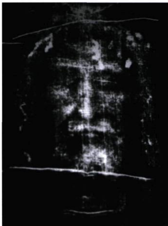
Secundo Pia, première photographie du Suaire de Turin, 1898.

On peut penser qu'une telle histoire comprendrait un volet consacré à l'étude des différents modes d'utilisation de la photographie dans les rites funèbres. De prime abord, on pense à la réalisation des portraits funéraires réalisés à l'aide du daguerréotype dès les années 1840. Mais l'utilisation de la photographie dans un contexte mortuaire ne se limite pas à cette seule catégorie. Si les historiens de la photographie se sont peu intéressés à ce phénomène, les ethnologues ont mis à jour et admirablement analysé un nombre considérable de pratiques funèbres utilisant, soit le dispositif photographique lui-même, soit, plus simplement, des clichés photographiques. Les recherches des spécialistes italiens sur les cimetières calabrais ont montré que la photographie joue un rôle important dans la constitution des rituels funèbres locaux et dans la conduite émotionnelle des gens éprouvés 1 . À la lecture de ces enquêtes, il apparaît clairement que le cliché photographique est encore conçu comme une interface entre le monde des vivants et celui des morts, un port d'attache auquel revient s'ancrer le défunt lors de la fête des morts, de Noël et de Pâques. Doit-on dès lors s'étonner que l'acte photographique soit décrit comme une opération visant à capter l'essence même de la vie; un morceau de vie que le cliché