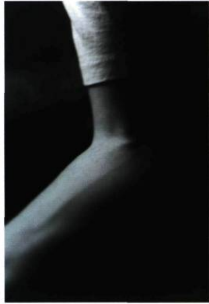
Anonyme, non daté.

en faveur de la Straight Photography , cette série s'inscrit dans les recherches de Stieglitz pour saisir la vérité, sa vérité. À propos d' Équivalents , le photographe affirmait : « Mes photographies sont une image du chaos du monde, et de ma relation à ce chaos. Mes tirages montrent la remise en question permanente de l'équilibre de l'homme, et son éternelle bataille pour le rétablir 9 ». Cette approche de la création, approche qui rappelle à bien des égards la démarche des artistes symbolistes fin de siècle qu'il a côtoyés au début de sa carrière, a souvent été occultée par les historiens, plus enclins à construire l'histoire de l'autonomie du médium qu'à s'intéresser à la démarche spirituelle du photographe. Il en est de même des témoignages de nombreux photographes sur l'importance de leur découverte du Zen sur l'évolution de leur démarche. On peut penser à l'autobiographie d'Alvin Langdon Coburn 10 ou encore à l'enseignement de Minor White, pour qui la création photographique était une façon de s'approcher de Dieu 11 .