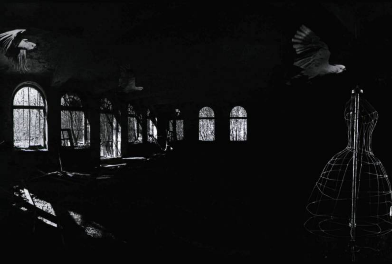
Zoe Beloff, Beyond , 1997. Image panoramique sur cédérom.