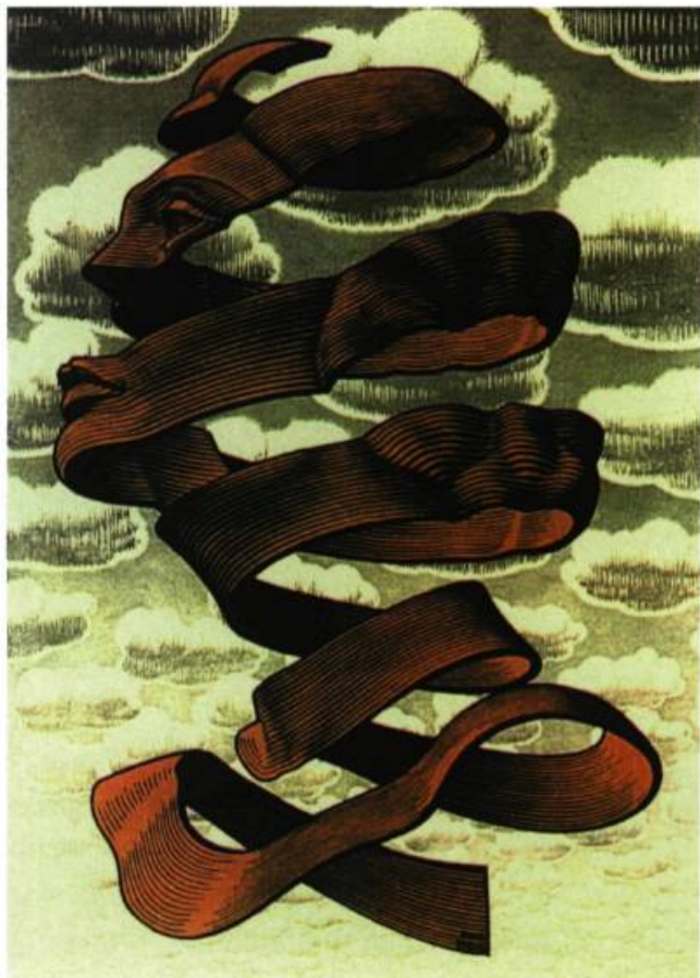
M. C. Escher, Écorce, 1955. Gravure sur bois de bout et gravure sur bois.