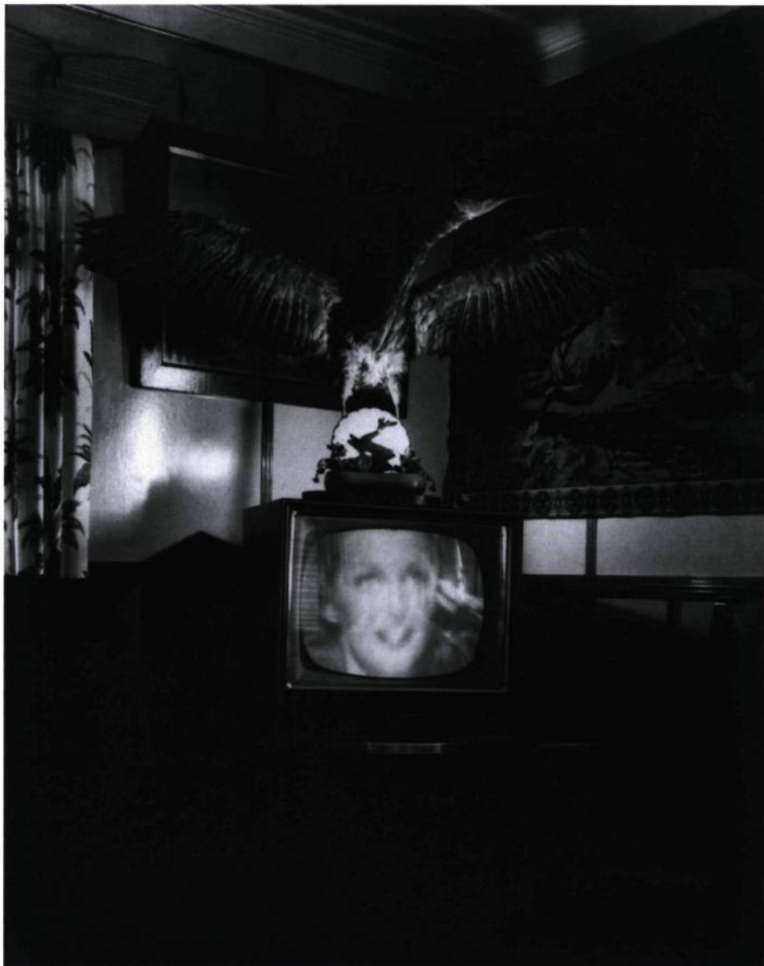
Gabor Szilasi, À l'Hôtel Cloutier, Saint-Joseph de Beauce , 1973. Épreuve argentique.