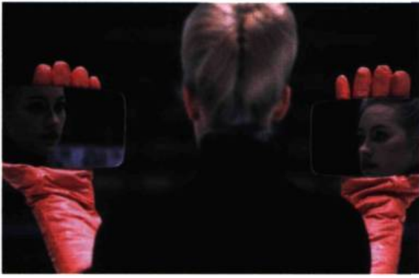
Asta Gröting, EIS , 1995. Projection vidéo, 28'18". Caméra: Martin Kressig. Courtoisie: CIAC, Montréal.