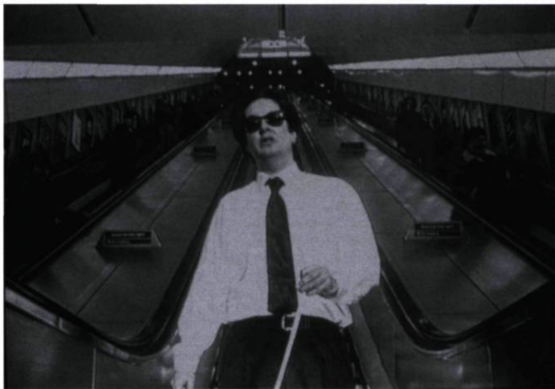
Mark Wallinger, Angel , 1997. Vidéogramme, 7' 30". Édition de 10 + 2 AP. © Mark Wallinger.

Biennale de Montréal '98, Centre international d'art contemporain de Montréal, Montréal. Du 27 août au 18 octobre 1998